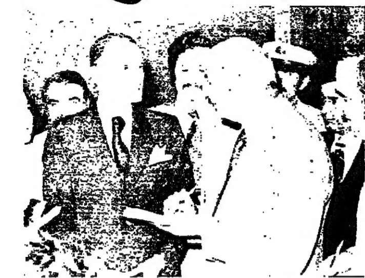
الشيخ بيار الجميل بعد مقابلة الرئيس فرنجية امس